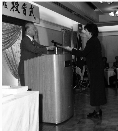
▲授賞の様子。先生方から賞状等を直接手渡しで頂き、その栄誉を称えます。